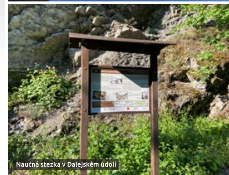
Naučná stezka v Dalejském údolí