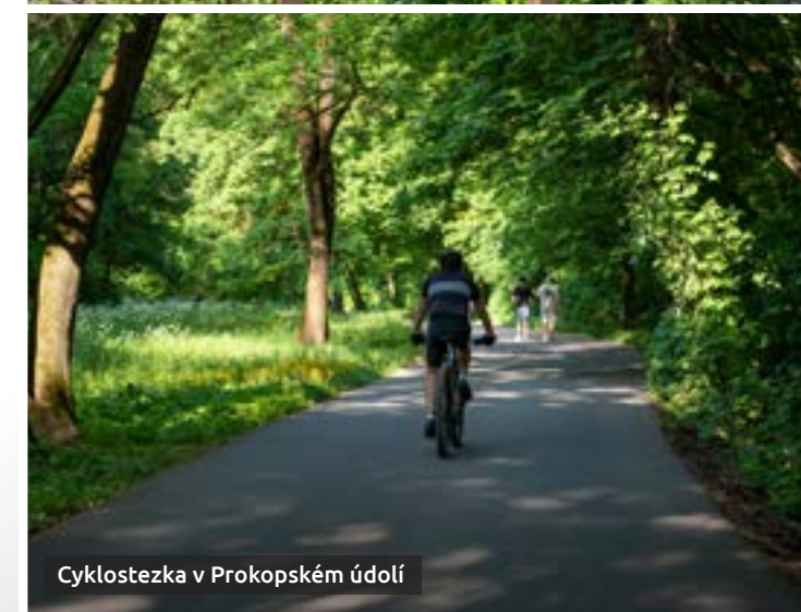
Cyklostezka v Prokopském údolí