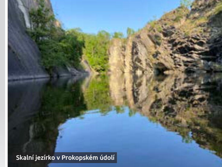
Skalní jezírko v Prokopském údolí

Topení: ústřední vytápění, deskové radiátory s termostatickými ventily, topný žebřík v koupelně.