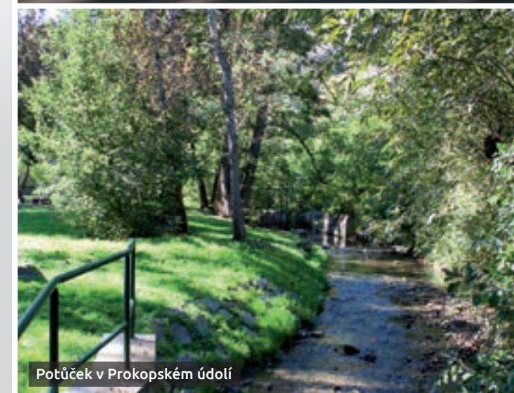
Potůček v Prokopském údolí